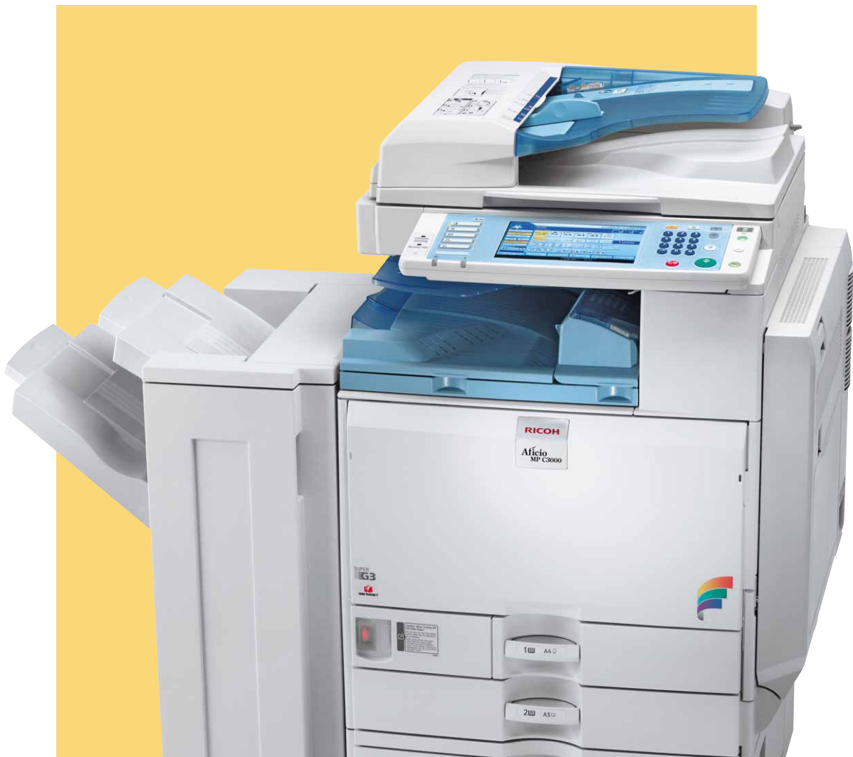
Aficio™ MP C2500/MP C3000